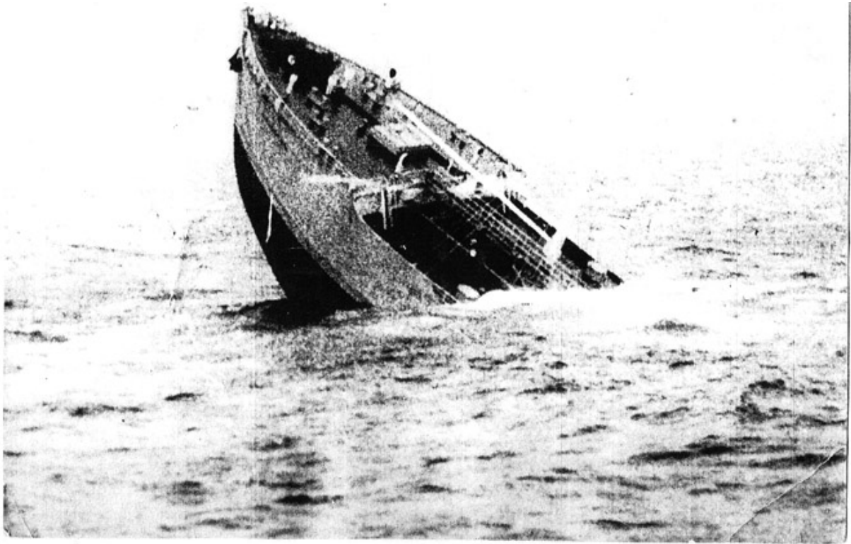
M/T SEIRSTAD – forskipet